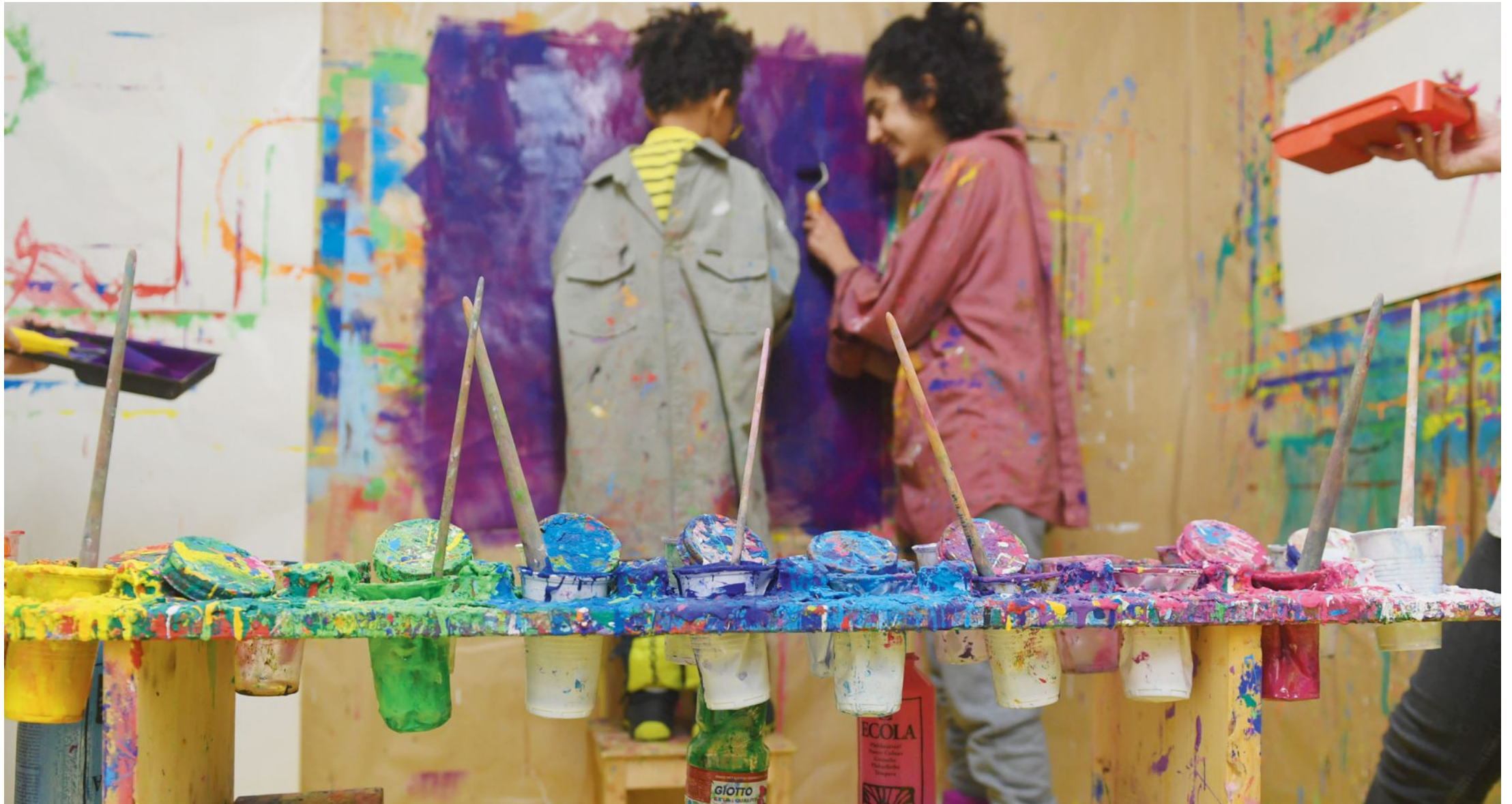
Les élèves, souffrant de retards d'apprentissage, retards développementaux ou troubles autistiques, ont tous apposé, dans la mesure de leurs capacités respectives, leur patte sur la peinture destinée à la Une du JdJ.

PAR MARISOL HOFMANN